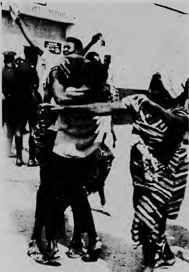
ACCRA, GHANA--Prisoneran politico ta ser poné den libertad, pa e regimen nobo di Ghana. Nan ta ser saluda pa nan familiarnan. Centenares di personanan a hanja nan libertad despues di e golpi di estado.

Aruba, 3 maart 1966 De secretaris w.g. J. Lammens.